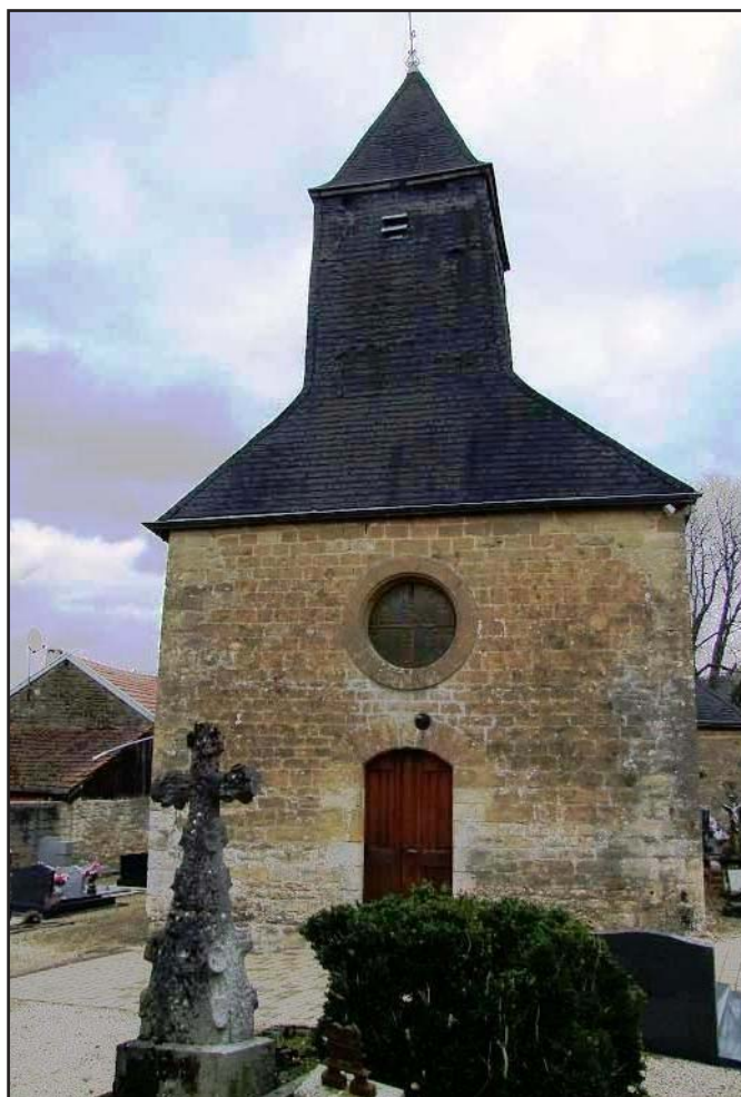
La façade toujours debout de l'église d'Étrépiigny où Meslier officia de 1689 à 1729.

Ainsi, par exemple, s'oppose-t-il avec acharnement à la distinction cartésienne entre la « substance étendue » (la res extensa ) et la « substance pensante » (la res cogitans ) pour être en mesure de démontrer la matérialité de la pensée et des sentiments. Pour Meslier, ceux-ci ne sont rien d'autre que des « modifications de la matière » chez les hommes, mais aussi chez les animaux.