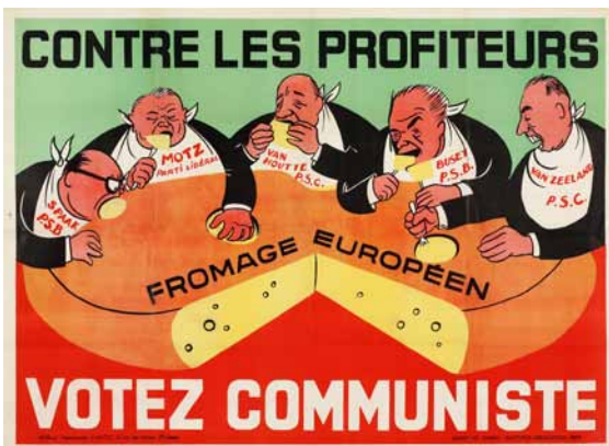
Affiche de Diluck pour le PCB, Bruxelles, 1954. Coll. privée