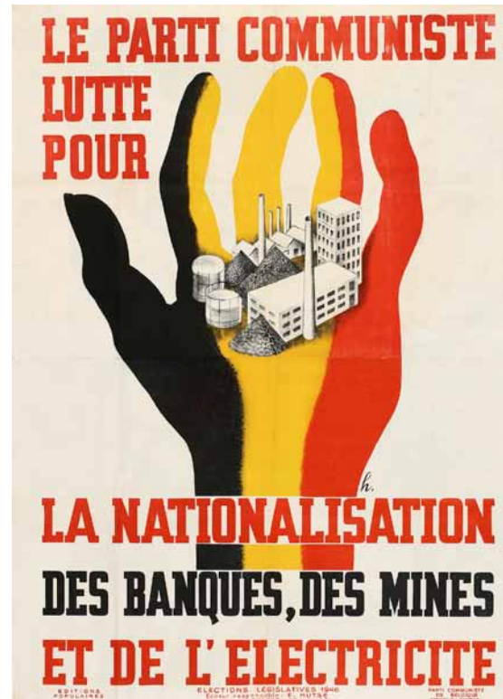
Affiche du PCB, 1946.