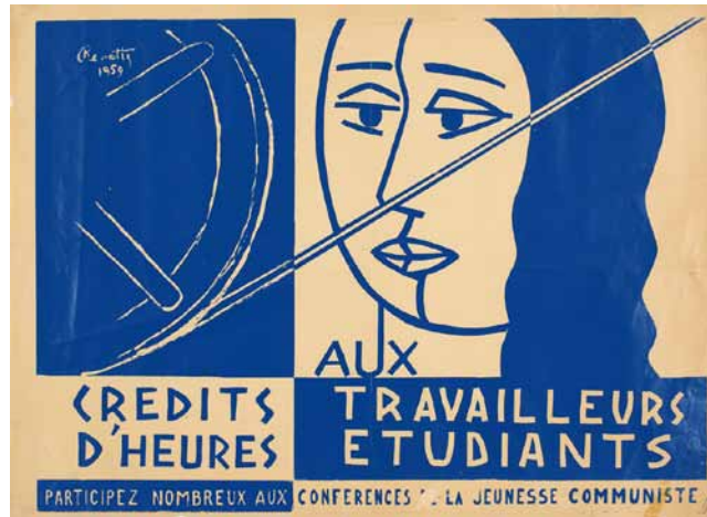
Affiche de Paul Renotte pour la Jeunesse communiste, Liège, 1959. Coll. IHOES.

En 14 thèmes, l'exposition aborde les combats menés par les groupes communistes en matière de revendications sociales (durée de travail, congés payés, etc.) ou au point de vue politique : opposition au fascisme, guerre froide, pacifisme, féminisme, solidarités avec des peuples en lutte (Vietnam, Congo...), combats contre les dictatures fascistes... Elle met en évidence les points de convergence entre les diverses mouvances en présence, mais fait aussi apparaître leurs divergences sur des questions telles que les élections ou la légitimité de la violence pour mener la révolution. Elle rend enfin compte de la richesse et de la vitalité de la culture communiste.