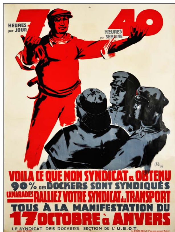
Affiche de Lode Sebregts publiée par le Syndicat des dockers, section de l'UBOT, 1937. Coll. Amsab-Institut d'Histoire Sociale, Gand.