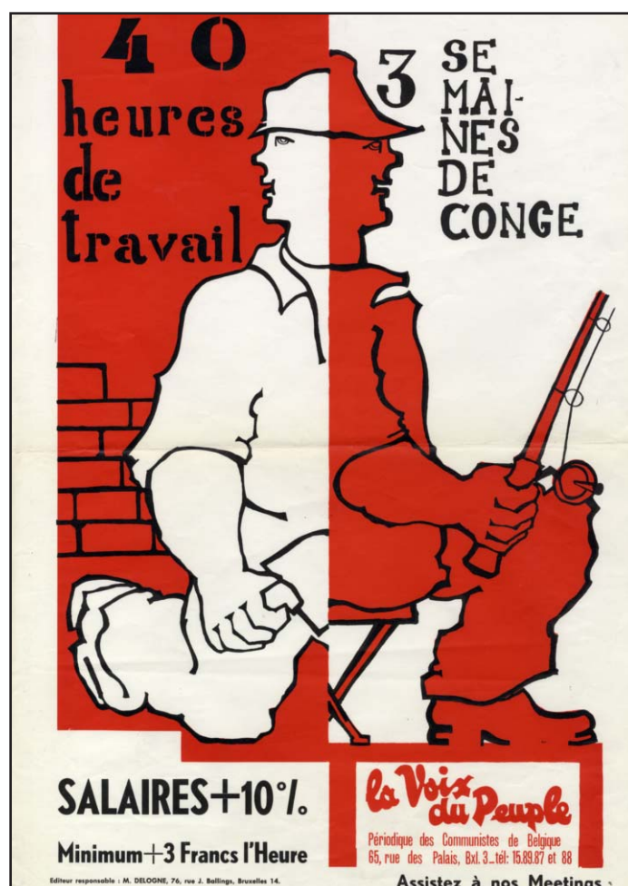
Affiche éditée par La Voix du Peuple . Périodique des Communistes de Belgique, 65, rue des Palais, Bxl. 3., tél. 15.89.87 et 88

À la veille de la Seconde Guerre mondiale et sous l'occupation, les conquêtes de l'entre-deux-guerres en matière de réduction du temps de travail ont été malmenées pour satisfaire aux besoins de l'économie de guerre (mise en place de dérogations aux lois de 1921 et de 1936, rétablissement de la journée des 48 heures par semaine dans les charbonnages, etc.). Ce recul législatif perdure quelques années après la guerre, la nécessité de reconstruire le pays primant sur les lois en vigueur et les syndicats préférant par ailleurs une hausse des salaires (et du pouvoir d'achat) à une réduction hebdomadaire du temps de travail. Durant cette période de reconstruction, la réduction de la durée du travail se poursuit néanmoins via un léger accroissement du nombre de jours fériés, dont le 1 er Mai dès 1946 – tout un symbole !