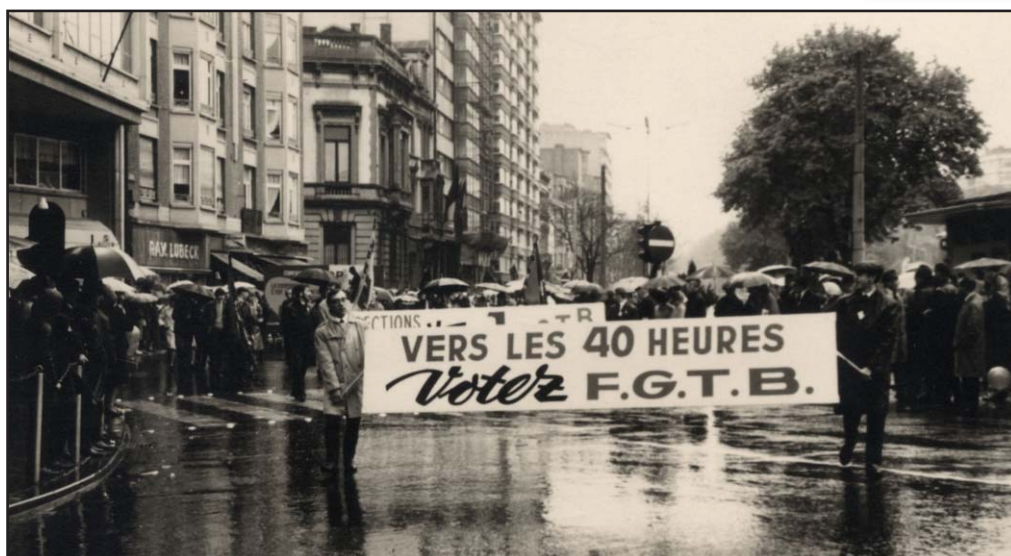
Manifestation de la FGTB pour la généralisation de la semaine de 40 heures, vers 1967.